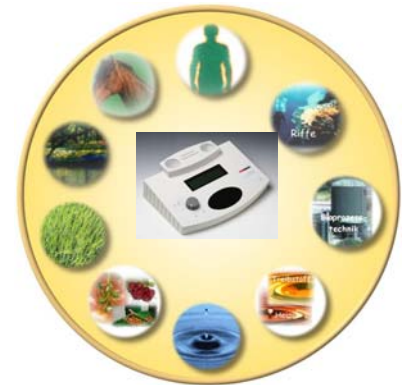
Radionica toepasbaar op alles wat leeft.

Deze firma behoort heden ten dage wereldwijd tot de toonaangevende ondernemingen en beschikt naast de traditionele instrumenten over een modern computergestuurd instrument, de M.A.R.S. III. waarmee de ingang naar een anders zo tijdrovende test en therapieprocedure is veranderd in een snelle en gebruikersvriendelijke procedure zoals nooit eerder vertoond. De naam staat voor M ultiple A nalytical R esonance S ystem. De testen worden uitgevoerd door een VIBA generator (Vast Interactive Biofield Analyser) op deze manier wordt uit een selectie van bijvoorbeeld 2600 homeopathische middelen getest welke 5 middelen in aanmerking komen voor behandeling van de klacht van de patiënt, of uit een lijst van 50 oorzaken worden de belangrijkste m.b.t. de problematiek geselecteerd, dit bespaart veel zoekwerk en men komt in korte tijd tot de kern van de problematiek. Ook wordt Radionica op deze manier veel gecombineerd met reeds bestaande methoden als electro-acupunctuur, kinesiologie of homeopathie.